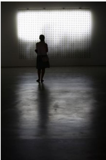
Obra de la serie 'Home videos' de Jim Campbell.

Sin embargo, el interés de Campbell no es mostrar una analogía, o contar una historia. “Lo importante para mí es esa experiencia primera, libre de todos los detalles que pueda atribuir la imaginación” dice Campbell. En una de las obras, lucecitas LED de color rojo dan vida a una imagen en la que carros y transeúntes pasan o se detienen alternándose. “El espectador entiende esa imagen porque está en movimiento, si la imagen que producen las LED se congelara, no se podría entender”, señala. De frente, sus cuadros luminosos representan algo en movimiento (gente, autos, agua), pero de costado, lo único que se ve son bombillitos intermitentes y resulta por un momento inverosímil inferir que ese mecanismo recree un cuadro.