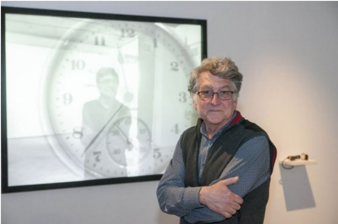
El artista estadounidense Jim Campbell.

Sin embargo, el interés de Campbell no es mostrar una analogía, o contar una historia. “Lo importante para mí es esa experiencia primera, libre de todos los detalles que pueda atribuir la imaginación” dice Campbell. En una de las obras, lucecitas LED de color rojo dan vida a una imagen en la que carros y transeúntes pasan o se detienen alternándose. “El espectador entiende esa imagen porque está en movimiento, si la imagen que producen las LED se congelara, no se podría entender”, señala. De frente, sus cuadros luminosos representan algo en movimiento (gente, autos, agua), pero de costado, lo único que se ve son bombillitos intermitentes y resulta por un momento inverosímil inferir que ese mecanismo recree un cuadro.